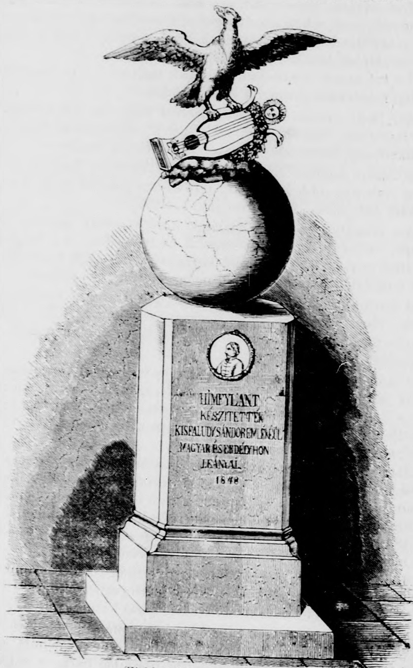
(Kisfaludy Sándor emlékszóbra.)