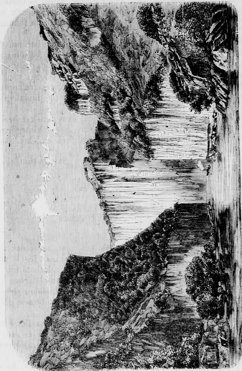
Az Orsova melletti zoroza.

1855. november 19-én délután 2 óraker a nemzet nagy fájdal-