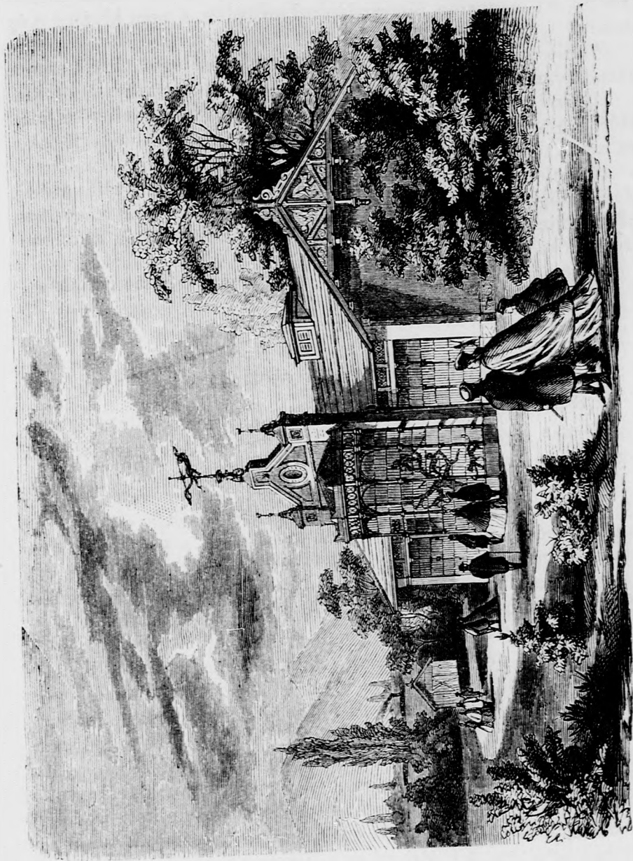
Majomház a pesti állatkertben.