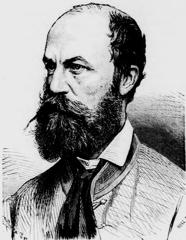
Jókai Mór. (Lásd a 636. lapon.)

s egyiránt lelkesültek mindnyájan. — Az ő képzelete bekalandozta az összes természetet, s össze szedve annak színeit, költői nyelvvel oly ragyogó képeket festett, minőket eddigelé nem látott az olvasó közönség. Ha a hazáról ír, forró honszerelme szikrázik, mint a tűz, — s olvasás után nem csak, hogy fellelkesülünk, de megfogadjuk, hogy mi is úgy szeretjük hazánkat mint ő, s nem leszünk ahhoz hűtelenek soha! — Nem keresi ő a gondolatokat, s gondolatai még is mindig újak, s e mellett mint érzései is tiszták és egészségesek.