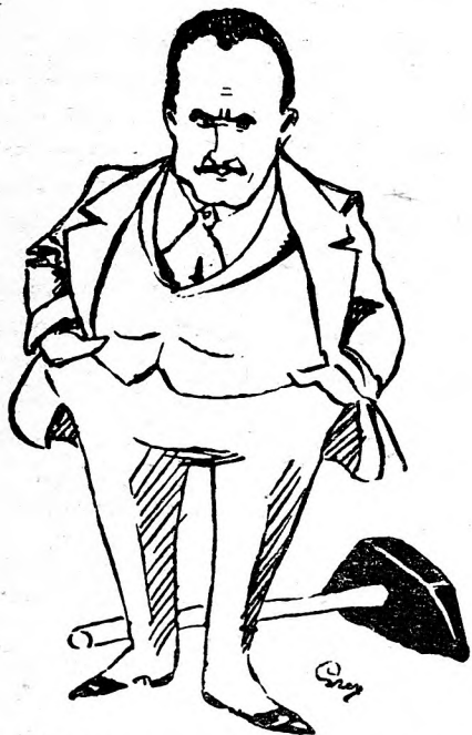
Garami és az elhanyagolt kalapács.