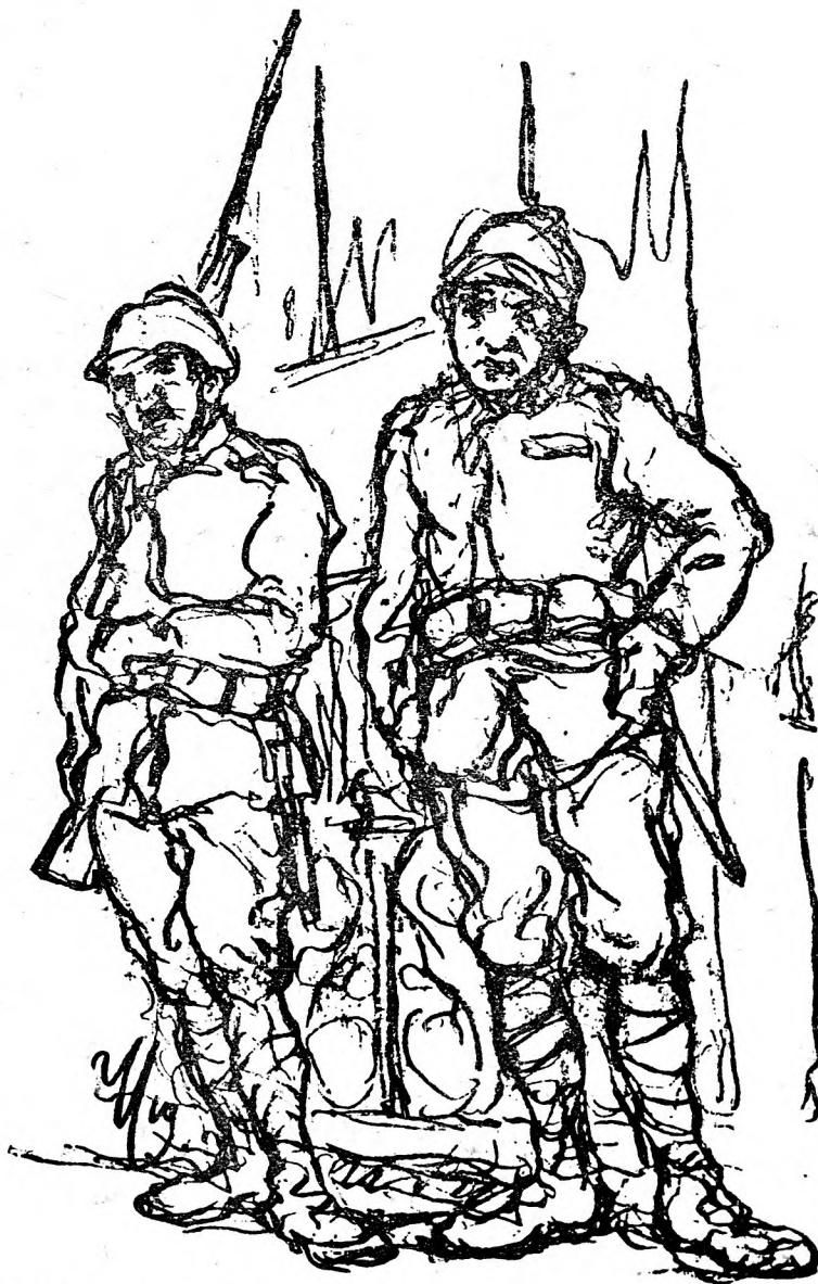
Az olasz misszió két katonája.