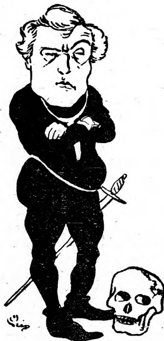
Beregi Oszkár, a „szovjet-színész” Hamlet szerepében: „Lenin vagy nem Lenin!”