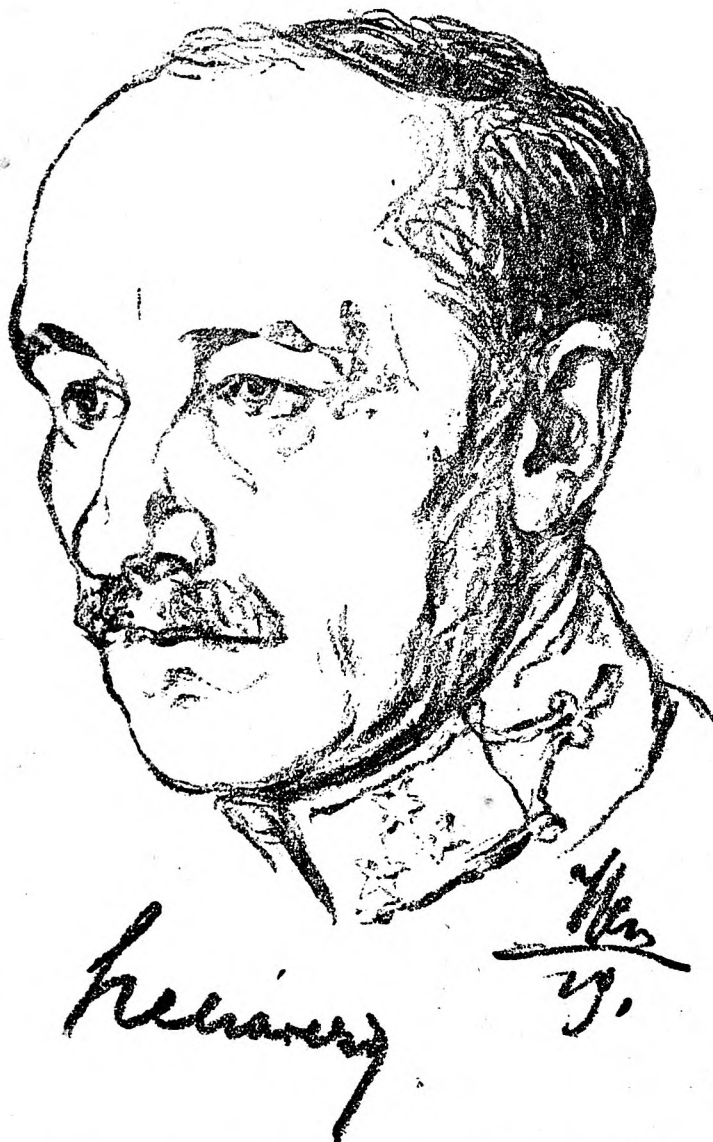
Hercz Imre rajza.

birka, jobbkezében két villamoskörte volt. Böhm vonatán temérdek élelmet, elsőosztályú lisztet, csokoládét, rizst, szemes kávé,