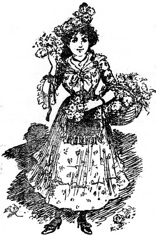
Milyen a virágáros leány a színpadon.