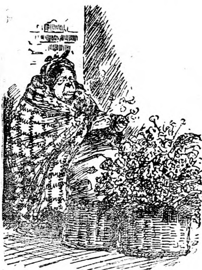
És milyen az utcán.