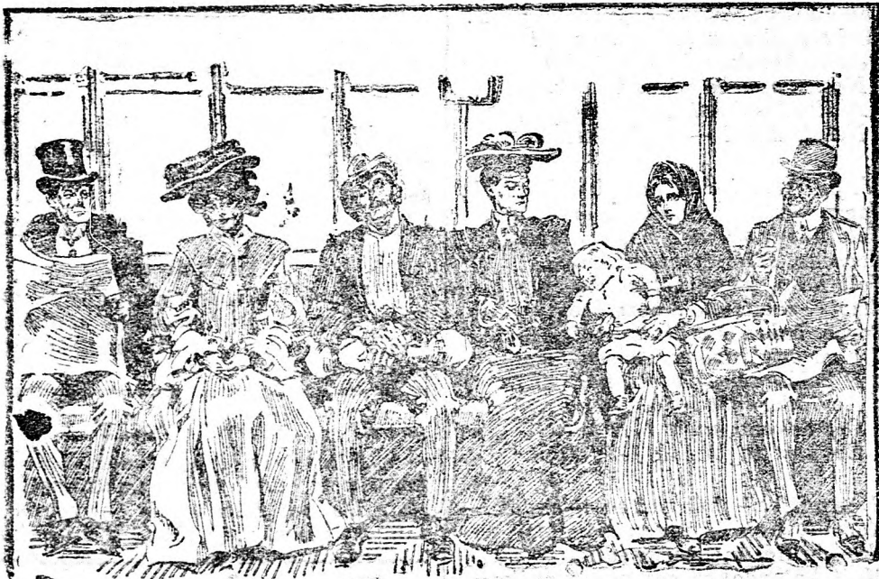
Kép a mindennapi életből.