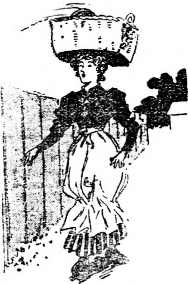
Szépen tovahalad a munkásleányka, Nem is tudja, mi szállt most a kosarába.