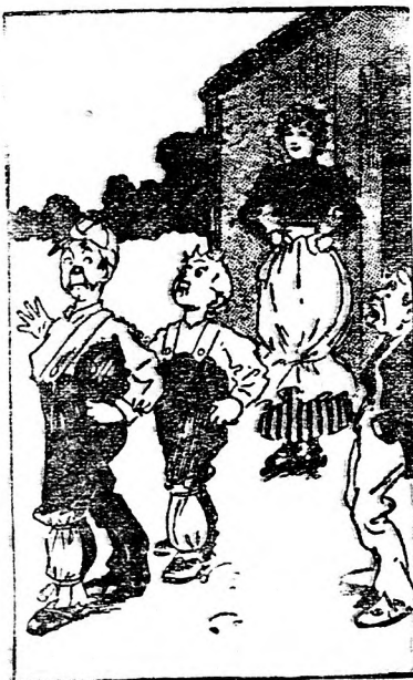
A labdát meglelik testvéri a lánynak, A régi gazdának büszkén fityet hánynak.