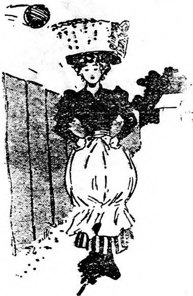
Ejnye, labdarugók, mért nem vagtok résen? Atropált labdátok im a kerítésen.