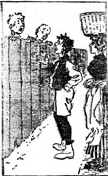
Keresik a fiúk, kutatják a labdát, Jaj, de megsiratták, mert csak tegnap kapták.