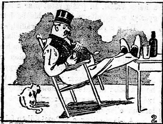
— Hogy elandalít!