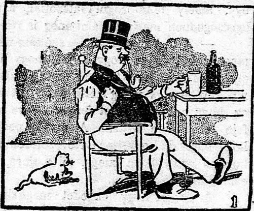
— Nincs jobb egy jó kortynál!