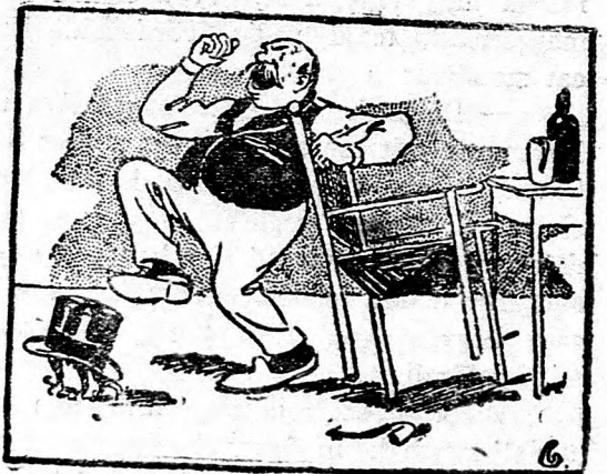
— Jesszus, Mária!