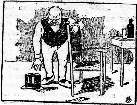
— Aha, itt a kalapom...