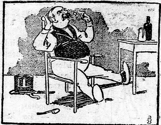
— Légyonat van erretele!