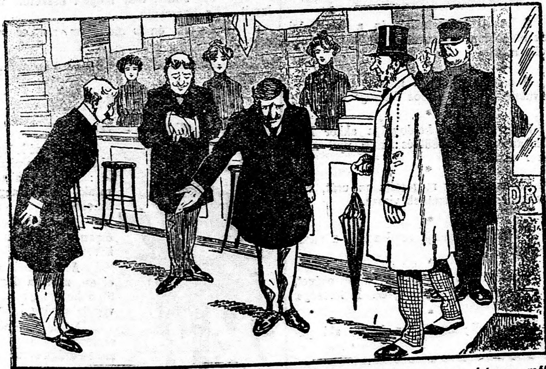
Bamba úr a felesége megbízásából bemegy egy üzletbe, hogy három méter pertlit vásároljon.