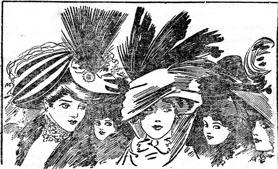
Mindnyájan az urakat nézik, vajjon az urak nézik-e őket.