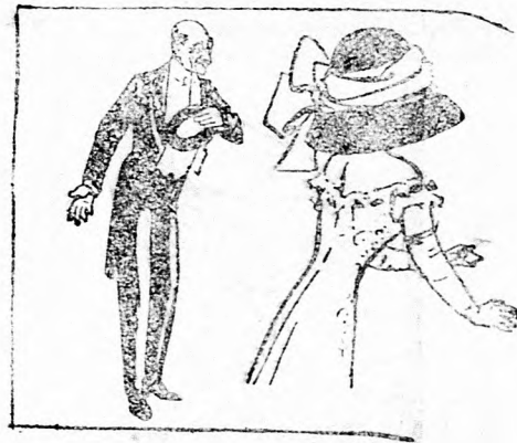
— A mindenteltakar kalap.