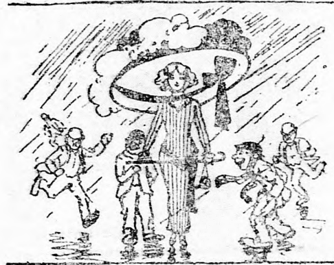
— Az esernyőkalap.