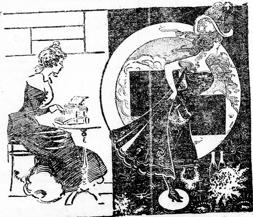
Adél kisasszony két foglalkozása.