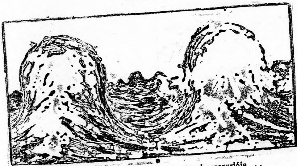
Egy tengeribetegségben szenvedő utas impressziója . . .