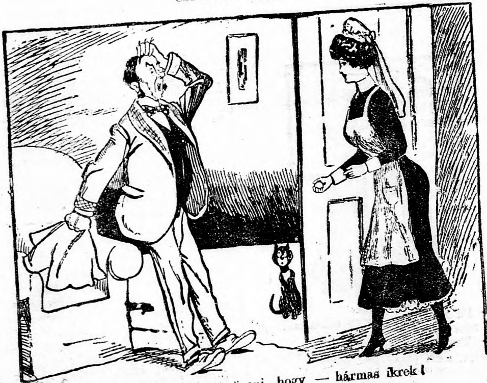
— A gólya néni azt üzeni, hogy — hármás ikrek!