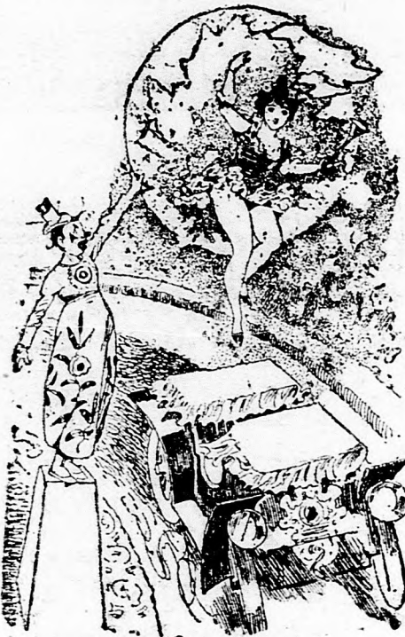
A dresszírozott automobil.