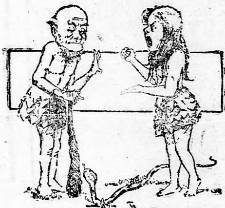
Az első beszélő gép.