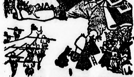
nehézebb elcsúsz, mert kényelmesebb állás.