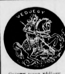
György lovag védjegye

Számtalan beteg kapta vissza egőzsőségét a „György életbalzsam” által, melynek gyógyhatása esodálatos