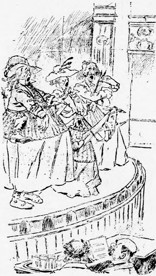
— A magyar színművészet netovábbja a városligeti műszinkörben.