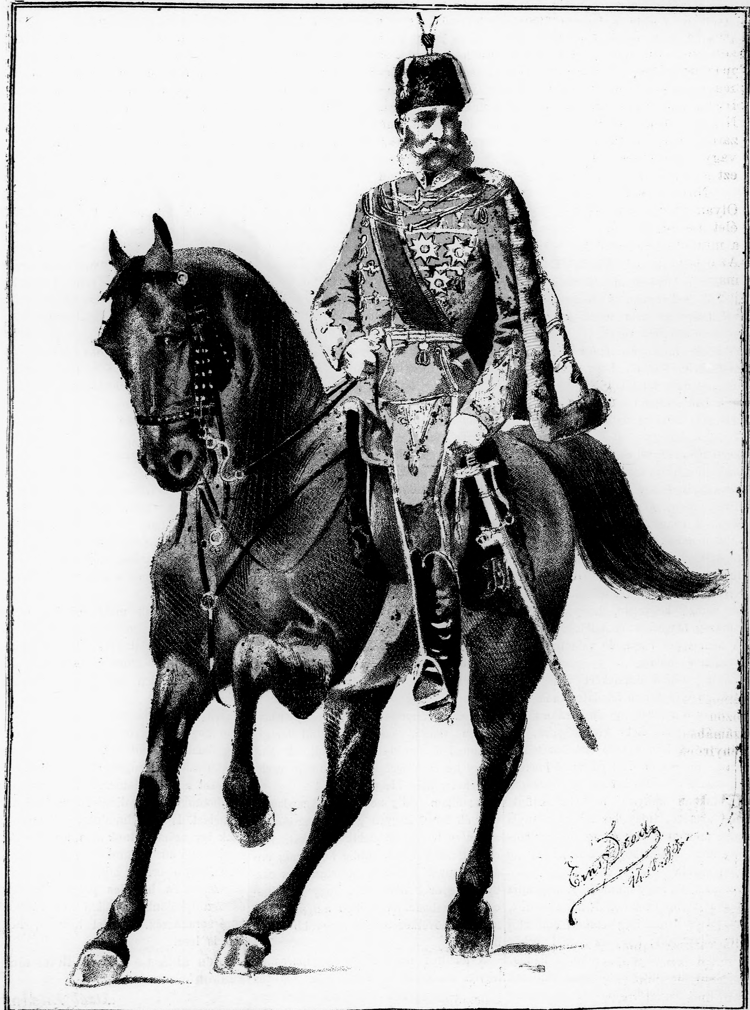
A magyar király.