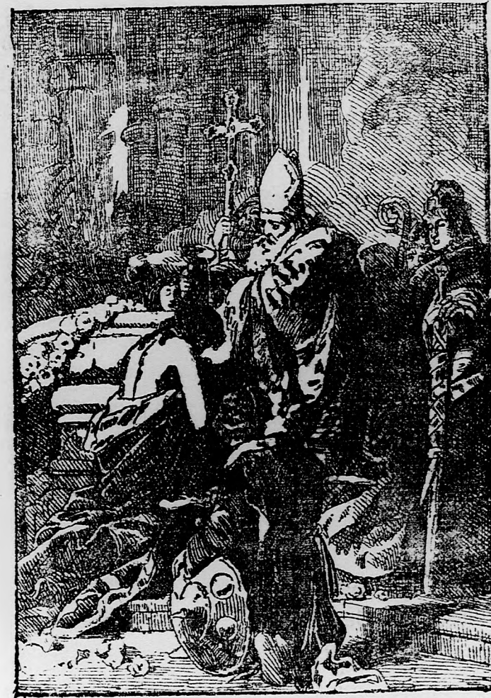
93 cm. magas és 62 cm. széles, ára 10 frt. Keretek beszerzési áron 6, 7, 8 és 20 frtért. BENCZUR e műve a nemzeti múzeum képtárának egyik legnagyobb dísz. Conceptióját, rajzát, színezését a bel- és külföldi kritika egyaránt a legnagyobb elismeréssel méltatta.

Aranykeretek darabja 5, 6, 7 és 15 forint.