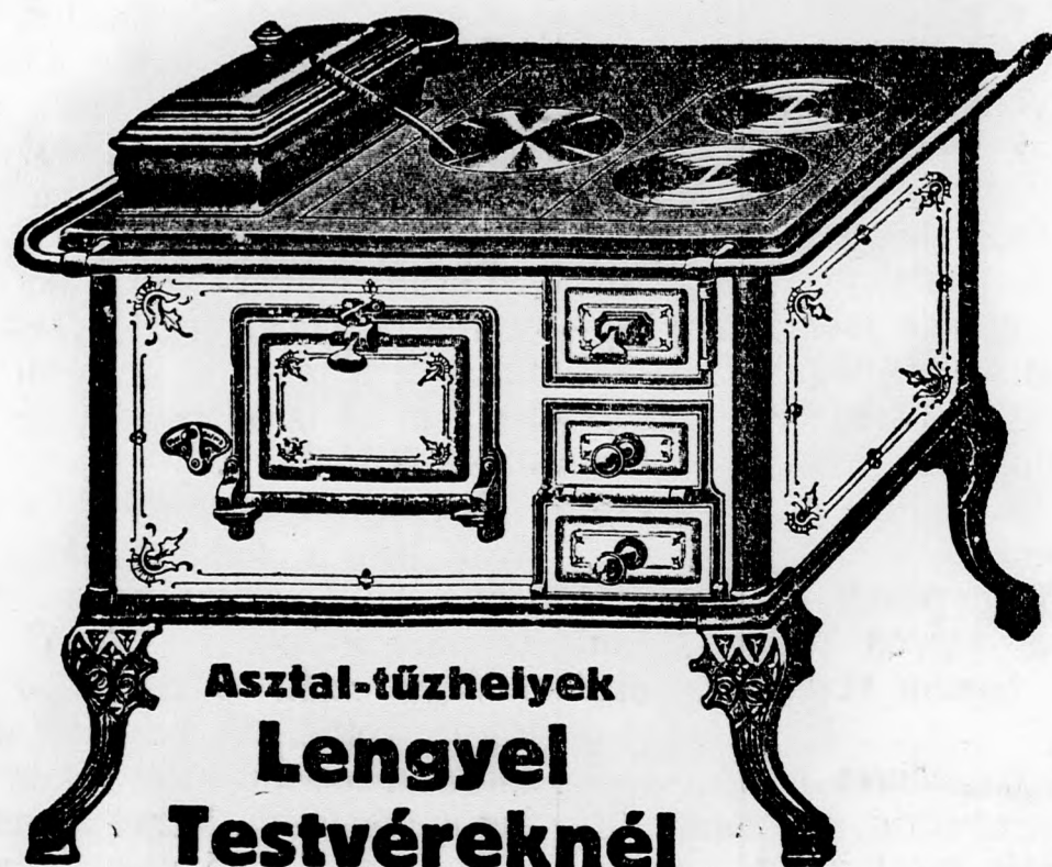
Asztal-tűzhelyek Lengyel Testvéreknél

Lipótvárosi Fonal és Textil Kereskedelmi Rt. Budapest, V., Lipót-körut 25.