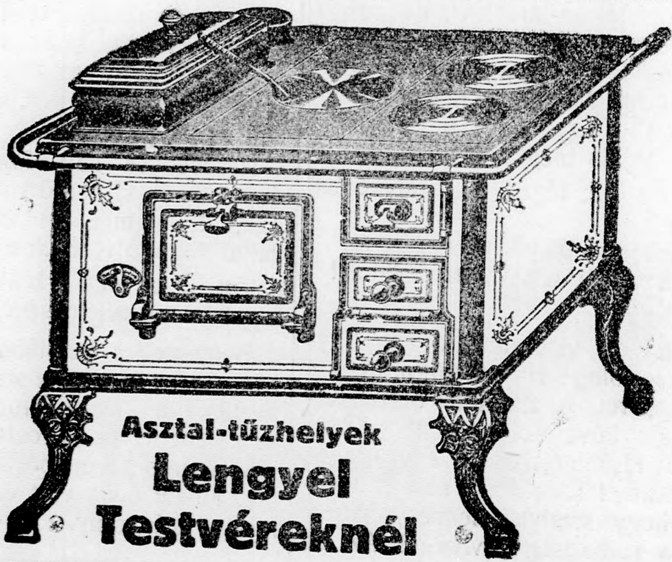
Asztal-tűzhelyek Lengyel Testvéreknél