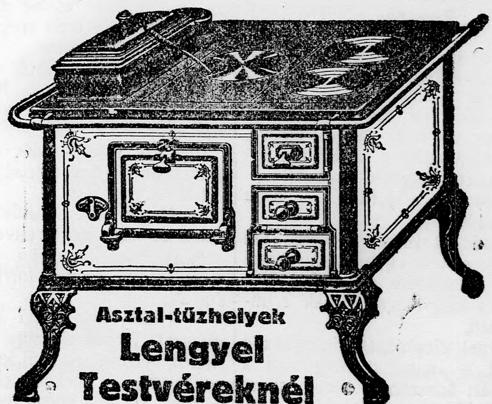
Asztal-tűzhelyek Lengyel Testvéreknél

keres fix fizetéssel és magas jutalékkal a Magyar-Francia Biztosító R.-T. vezérigynöksége Kaposvár, Fő-utca 14. Kezdeket az üzletszerzésre betanítunk.