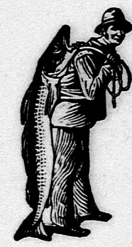
Az Emulsió vásár- lásánál a SCOTT- féle módszer véd- jegyét — a halászt — kérjük figye- lembe venni.

Egy eredeti üveg ára 2 K. 50 fillér. Kapható minden gyógytárban.