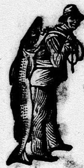
Az Emulsió vásárlásánál a SCOTT-féle módszer, védelmet nyújt a halászok számára.

Egy eredeti üveg ára 2 K. 50 fillér. Kapható minden gyógyszerárban.