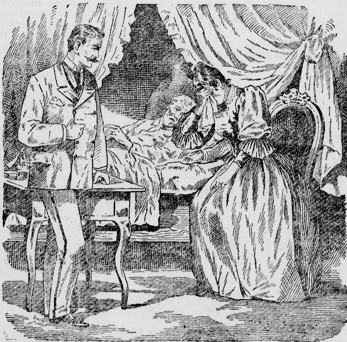
Der Theater-Teufel. Ihr ganzer Körper bebte vor Schmerz.

Draußen wurde es Abend. Langsam sank die prächtige Sonnenkugel hinunter.