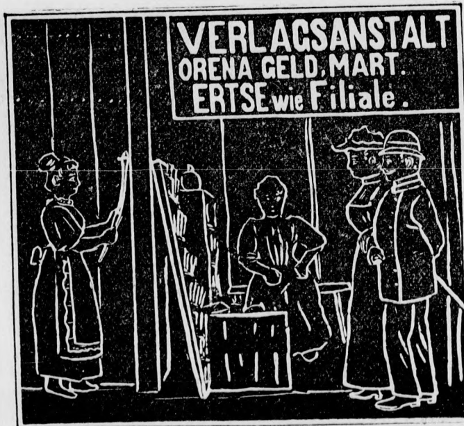
(Auflösung folgt in nächster Nummer.)