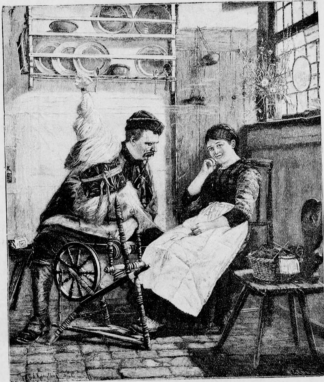
Sinnen und Minnen.

Heißes Wasser als Heilmittel. Ein englischer Arzt schreibt: Geringe Kopfschmerzen hören bei gleichzeitiger Verwendung von heißem Wasser auf den Nacken und die Füße bald auf. Eine in heißes Wasser getauchte, rasch ausgewundene Serviette auf den Magen gelegt, wirkt beinahe augenblicklich gegen Stößen. Nichts heilt rascher eine Lungenentzündung, eine Halsentzündung (Angina) oder einen Rheumatismus, wie Heißwasserkompressen. Eine mehrfach zusammengelegte, in heißes Wasser getauchte und dann ausgewundene Serviette auf die schmerzhafteste Stelle gebracht, bringt bei Zahnschmerzen und Neuralgien (Nervenschmerzen) bald Erleichterung. Ein mit heißem Wasser eingetauchtes Flanellstück um den Hals eines von Krüppeln befallenen Kindes gelegt, erzeugt in fünf bis zehn Minuten auffallende Beruhigung. Dieses gelingt namentlich bei dem sogenannten Pseudokrüpp (falschem Krüpp).