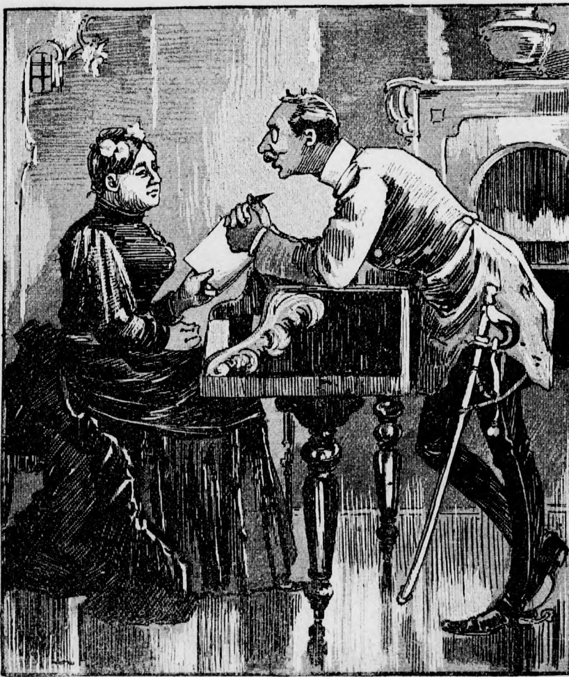
„Sie waren in Neapel, Herr Leutnant?“ „Ja, ich hab mir'n bißchen was vom Besuch vorspielen lassen.“