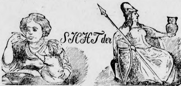
(Auflösung folgt in nächster Nummer.)

Aus der Kinderstube. Glise (zu ihrem neugeborenen Brüderchen): „Du, das muß ich Dir schon gleich sagen, bei uns wird nicht geschrien, Papa erlaubt das nicht.“