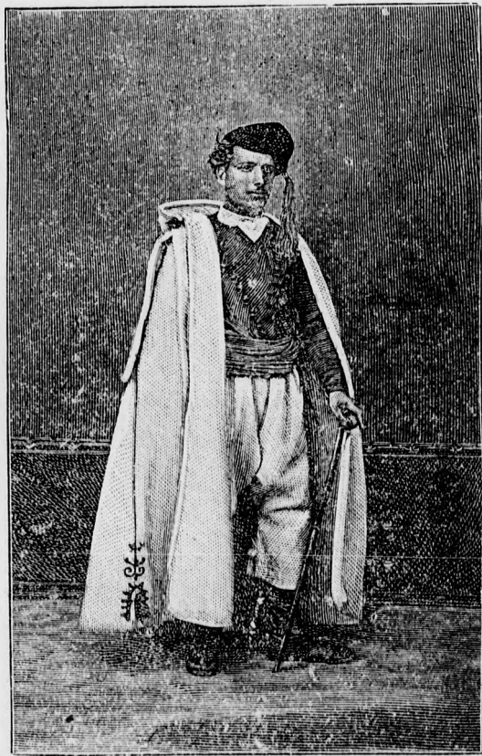
Ein Bewohner der Sphakia.

Einen Augenblick zauderte er. Ob der alte Herr wohl bereits die Schreckensbot-