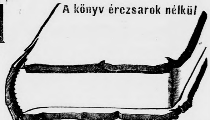
A könyv ércsarkok nélkül