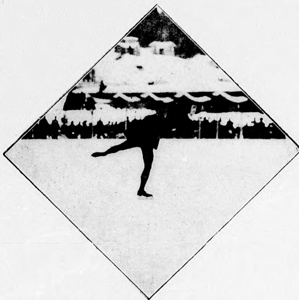
Műkorcsolyázás a davosi jégpályán.

14. Ha a labda a pályát az oldalvonalon át hagyta el, a bíró azon a ponton, a melyen a labda útja az oldalvonalat keresztelte, azon párt egy embere által, a melyeknek ellenfele a lab-