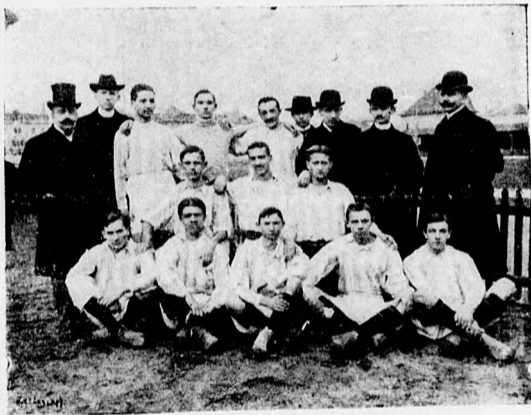
Ferencvárosi Torna-Club II. az 1904. évi »Szövetségi díj« győztese.

○ A Magyar Labdarugók Szövetsége f. hó 20-iki tanácsülésén tudomásul vette a bécsi labdarugó szövetség átíratát, melyben a szövetségi matchek terminusait ápr. (Budapest) illetve október (Bécs) első vasárnapjára kívánja megállapítani. A 33. F. C.—Ferencvárosi T. C. szeptemberi matche ügyben 17 szóval 5 ellen akként döntött, hogy Depold igazolása a bemutatott igazolójegy és egyéb, az igazolásra nézve döntő fontosságú okmányok alapján tudomásul vétetik s a match ennek alapján végleg igazoltatik. Ez igazolás után a Tanács megállapítja az idei bajnokság sorrendjét, mely szerint az I. osztályu bajnokságot a M. T. K. csapata nyerte meg 25 ponttal; a II-ik a F. T. C., III. a B. T. C. csapata lett. A másodosztályban Ujpesti T. C. győzött 26 ponttal; II-ik a III-ik kerületi T. V. E., III. a B. A. K. csapata lett. Az osztályozó mérkőzéseket illetőleg akként döntött, hogy a Föv. T. C. csapatát szabályok értelmében I. osztályban hagyja, az Ujpesti T. E.-t pedig az osztályozó mérkőzésen elért eredménye alapján szintén első osztályba sorozza. A 33 F. C. III. kerületi T. E. osztályozásának ügyében bevárja az intéző bizottság javaslatát. Az intéző bizottság abbéli ja-