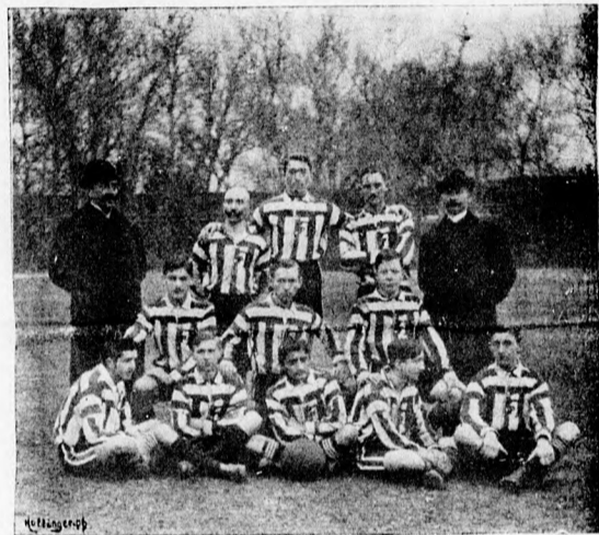
A Pozsonyi Torna-Egylet csapata

Azaz pardon, folytassuk Persze a tavasszal a Magyar Athletikai Club is nyert a Föv. T. C. ellen Csak hogy hol? a margitszigeti pályán. A mérkőzés napján a Fővárosiak szerencsétlenségére regatta-verseny volt a Dunán. Ismeretes a Föv. T. C. játékosainak lelkes