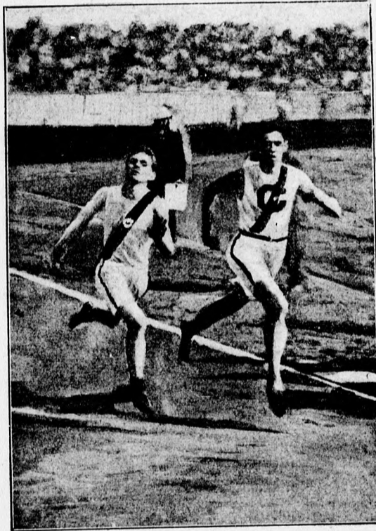
1904. évi amerikai kollegium-bajnokság 2 angol mföldes síkfutásának finishe.

Az Athletic Almanach for 1905. felvétele nyomán.