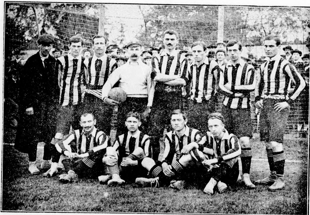
A Vienna Cricket and Football-Club csapata.

nyakára tenni. Tessék a dolgot alaposan előkészíteni. Tessék már az 1906. évi bajnokságot az új beosztáshoz szabott felületekkel kiírni, akkor minden jogsérelem és következmény nélkül megkezdhető lesz majd az ősz-tavaszi fordulóban lejátszandó III. osztályú bajnokság 6-os beosztással.