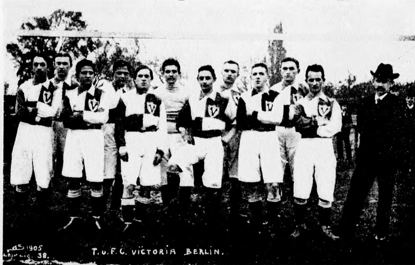
T. u. F. C. Viktoria, Berlin.

A Margitsziget alsó csücsáról nézni a versenyt, unalmas dolog s onnan nem nyujt olyan látványt és élvezetet, a melynek megismétlésére az ember vágyakoznék. Más