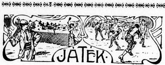
A B. T. C. Berlinben.

(Az olimpiai játékok helyén nagybizottsága, elfogaltsága dacára is, roppant figyelmesen és a diplomáciai udvariasság szabályainak betartásával érintkezik az egyes nemzetek bizottságaival. Erről tesz tanúságot, hogy a görög nagybizottság az újév beköszöntővel az összes nemzetek bizottságait szívélyesen üdvözölte, hangsúlyozván, hogy kívánatosnak tartja a nemzetek közti béke és egyetértés fenntartását, a kultura felvirágozásának és az emberszeretet fokozásának szempontjából.