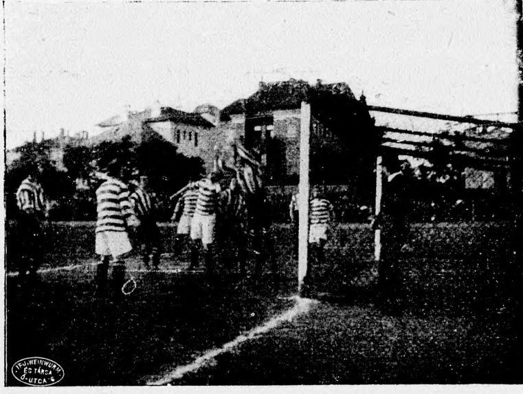
Celtic támadásai a Southampton kapujára.

(Budapest, 1906. június hó 4-én.) Eredmény 1 : 0 Celtic F. C. javára.