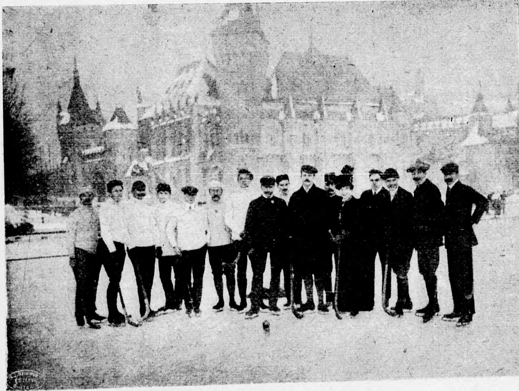
A Budapesti Korcsolyázó Egylet jég hockey-csapatai 1906/7-ben.