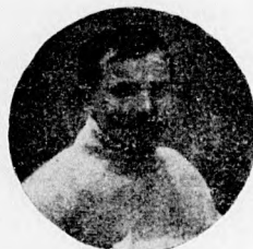
A magyar labdarugósport megalapítói.