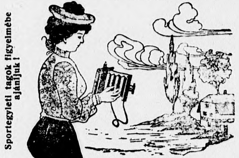
Sportegyleti tagok figyelmébe ajánljuk!