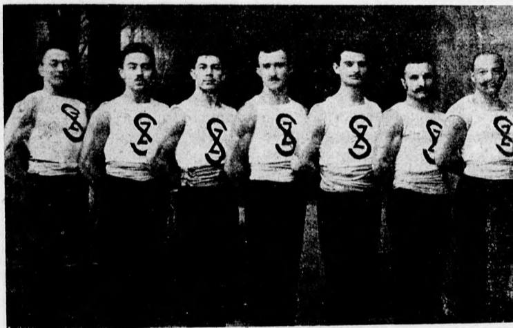
A „Szegedi Torna Egylet“ tornász mintacsapata.

A célravezető eszközöket, mint fentebb említettük, különbözőképen kellene megválogatnunk a kor és képzettség szerint, mindazonáltal az eszközök megválogatásánál szerencsére nem kellene a sötétben, járatlan utakon tapogatóznunk. Minden téren, részben külföldi példák alapján, találunk a cél-élérése szolgáló jól kidolgozott tervezeteket, sőt meghonosított intézményeket is, melyek az első próbát már kiállották. Vessünk csak