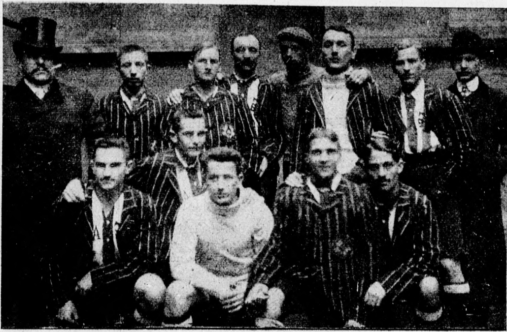
A Budapesti Torna Club Prágában szerepelt győztes csapata.

Egyébként figyelmébe ajánljuk az Evezős-Szövetségnek, hogy — a multak tapasztalatain okulva, — az idej versenyeken a rendezés legyen legalább valamivel jobb az előző évek rendezésénél. Különösen arra volna fektetendő a főszű, hogy hosszú szünetekkel ne tétessék unalmassá a regatta.