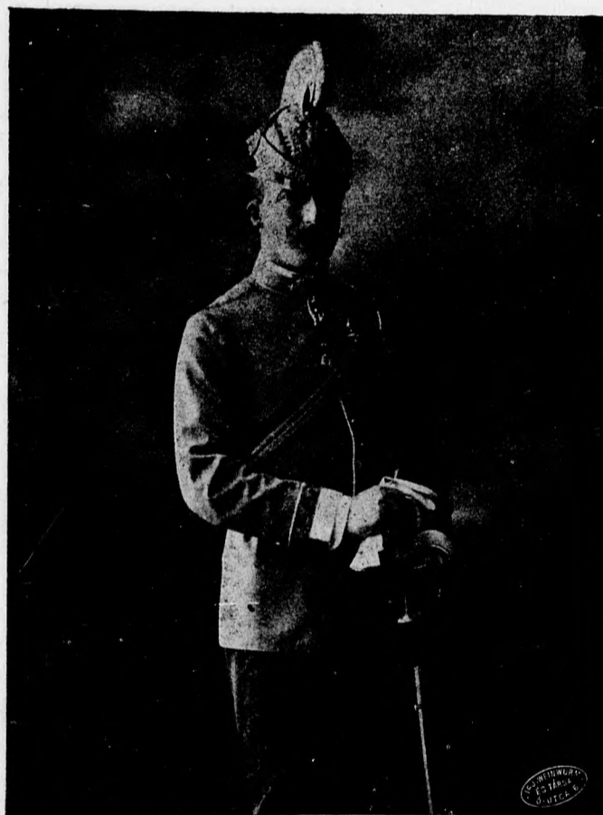
József kir. herceg Ö fensége a MOTESz pünkösdi ünnepélyének fővédnöke.

Nagy munkáját mintegy betetőzi az igazgatóság azzal, hogy az általános magyar sportéletre és az iskolai testedzés kérdéseinek megoldására terjeszkedik ki. Június hó utolsó napjaiban összeül a Magyar Testnevelési