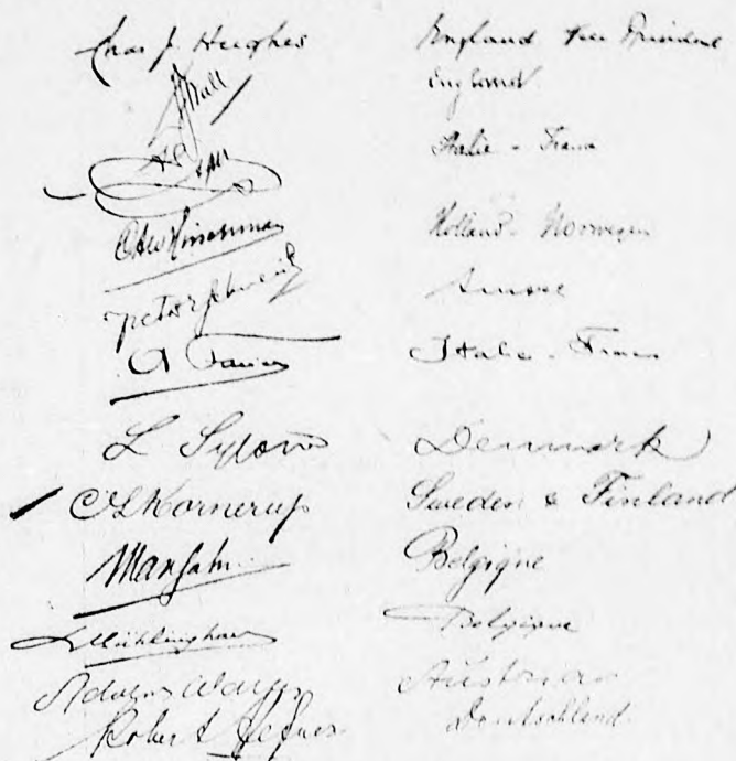
A Nemzetközi Labdarúgó Szövetség bécsi kongresszusán résztvevő kiküldöttek nóválírásai.

E két mintacsapatverseny mellett kiváló sikerrel szerepeltek a tetszés szerinti anyagot bemutató mintacsapatok.