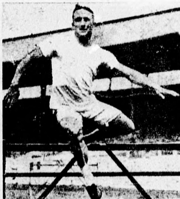
SMITSHON (Amerika) a 110 méteres gátfutás győztese.