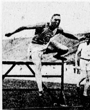
GARRELS (Amerika) 2-ik a 110 méteres gátfutásban.