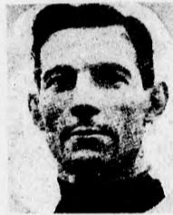
BRAGLIA (Olaszország) az egyéni torna- versenyek győztese.

)( Ajándékok Dorandónak. A londoni olimpiai játékok diszkvalifikált marathongyőztesét, az olasz Dorandót, az angolok elhalmozzák ajándékokkal. Az angol királyné értékes aranyserlegén kívül aranyórát lánczsal, gyémántgyűrűt és egyéb számos értékű tárgyat ajándékoztak neki. A »Daily Mail« Conan-Doyle, a hirneves angol regényíró felhívására 300 fontot (hétezer négyszáz korona) gyűjtött össze Dorandónak és ezenkívül még egy művészi kivitelű arany czigaretta-szelenczét is adományozott neki. — Dorandó lakóhelyén Carpián, Modena mellett, cukrász-üzletet szándékozik nyitni ebből a pénzből.