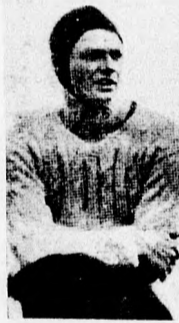
DANIELS (Amerika) Halmay legyőzője.