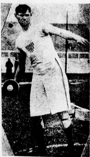
SHERIDAN (Amerika) a diszkoszvetés győztese.

Es itt, ha abból az egyedül helyes alapelvből indulunk ki, hogy a rekordtáblázat, egy faj atletikai kiválóságának fokmérője, felmerülhet az a kérdés, hogy helyes-e az az intézkedés, hogy például a magyar ember, külföldön elért sikere révén nem szerepelhet a magyar faj kiváló képességeit visszatükrözőtető kimutatásban?