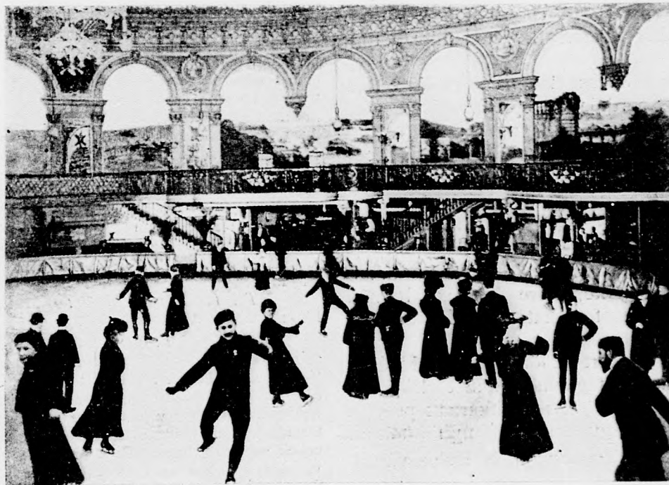
A párisi „Palace de Glace”.

Az új csarnok 10 m. széles és 22 m. hosszú, emeletes épület nagy karzattal. Belső berendezése a legmodernebb. Tágas öltözőhelyiségek, fürdőszobák, mosdó kabinok vannak a földszinten és az emeleten. Az egész helyiségben villamos világítás van. A belső berendezés vetekszik bármely fővárosi csarnok berendezésével. A szerek kitűnőek.