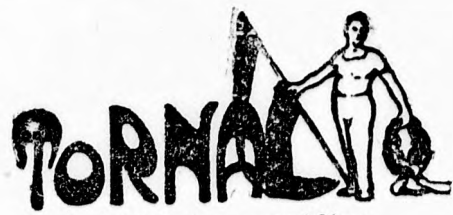
A BTC tornaestélye.

Elvitathatatlan, hogy a Budapesti Torna Club legtevékenyebb testedzősport egyesületünk egyike. Alakulása óta, megszakítás nélkül ugyszólván minden testedző sportnemet gyakorolt. Tagjai tornáztak, atletizáltak, kerékpároztak, vívtak, footballoztak, usztak, birkóztak, boxoltak stb. Nem zárkózott el semminemű testgyakorlástól. Az atletikát régente egyedül a BTC terjesztette a vidéken. Saját költségén rendezett már a 80-as években atletikai torna és egyéb versenyeket Salgótarjánban, Rimabányán, Ajácskövön és más oly helyeken, ahol a sport iránti szeretetet vélt találni.