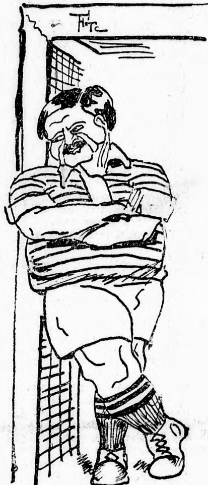
Kéne English Wa deres, kéne Woodward — mi?