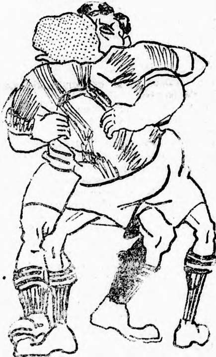
Ugy ölelko nek, mint ha verekednének, no be szent a béke!