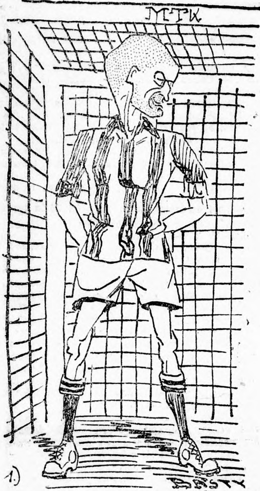
Kéne Blackburn Rovers metch ugy-e?

A dísz-torna többi része szép volt és gyorsan per-