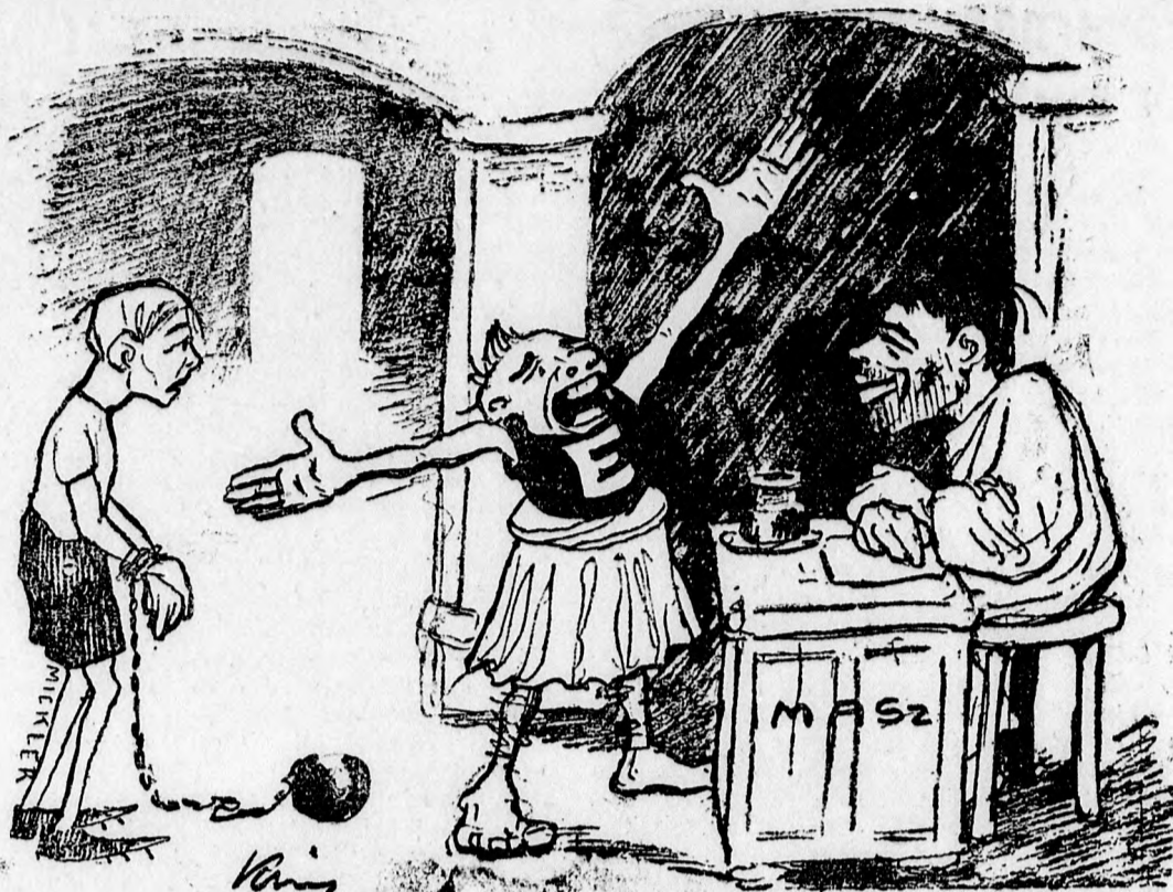
Feszítsd meg! Feszítsd meg!

Szolnokon rendezik meg március 1-én a Délmagyarországi kerület mezei futó bajnokságát.